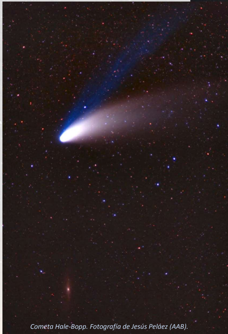
Cometa Hale-Bopp.