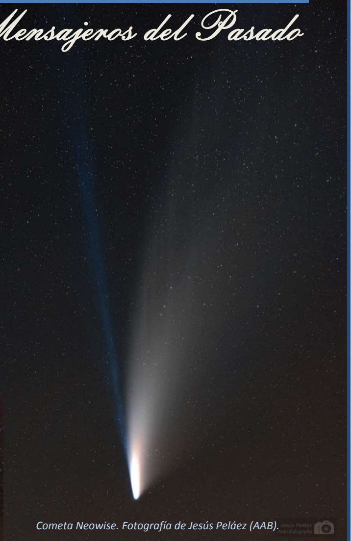
Cometa Neowise.

Otro cometa que nos dejó atónitos fue el cometa Hale-Bopp, un auténtico espectáculo que superó todas las expectativas, ya que fue visible durante 18 meses. Se le apodó como el Gran Cometa de 1997. Lamentablemente, si no fuisteis testigos de este cometa en su último acercamiento al Sol, ya no lo vais a poder observar, pues no vuelve a pasar hasta dentro de más de 2000 años.